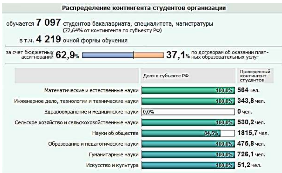
Рисунок 1.1. Приведённый контингент студентов в Республике Калмыкия (по данным мониторинга эффективности вузов за 2016 год)

Как видно из представленных данных, программы высшего образования, относящиеся к приоритетным интересам государства в области инженерного дела и педагогики, реализуются только в КалмГУ, при этом доля обучающихся в приведённом контингенте по этим направлениям подготовки суммарно составляет в КалмГУ 42,5%.